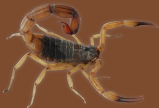
ESCORPIÃO-AMARELO ( Tityus serrulatus )

Duas espécies encontradas em Minas Gerais podem causar acidentes graves: