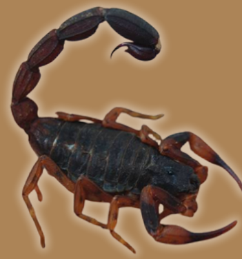
ESCORPIÃO-MARROM ( Tityus bahiensis )

Possui patas e cauda amarelo-claras e o tronco escuro. É considerada a espécie mais venenosa da América do Sul.